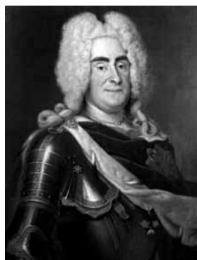
Zygmunt III Waza (1587–1632)