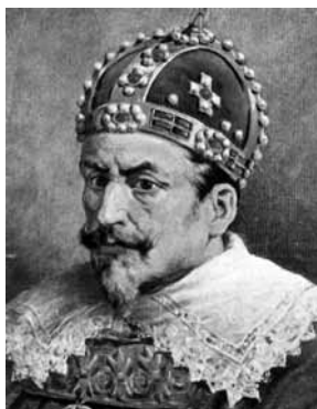
Zygmunt August (1548–1572)