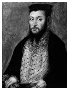
Władysław Jagiełło (ok. 1351–1434)